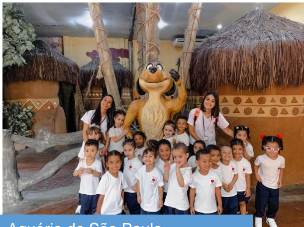
Aquário de São Paulo