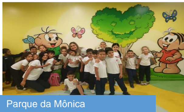
Parque da Mônica

Quadro comparativo entre metas propostas e resultados alcançados: