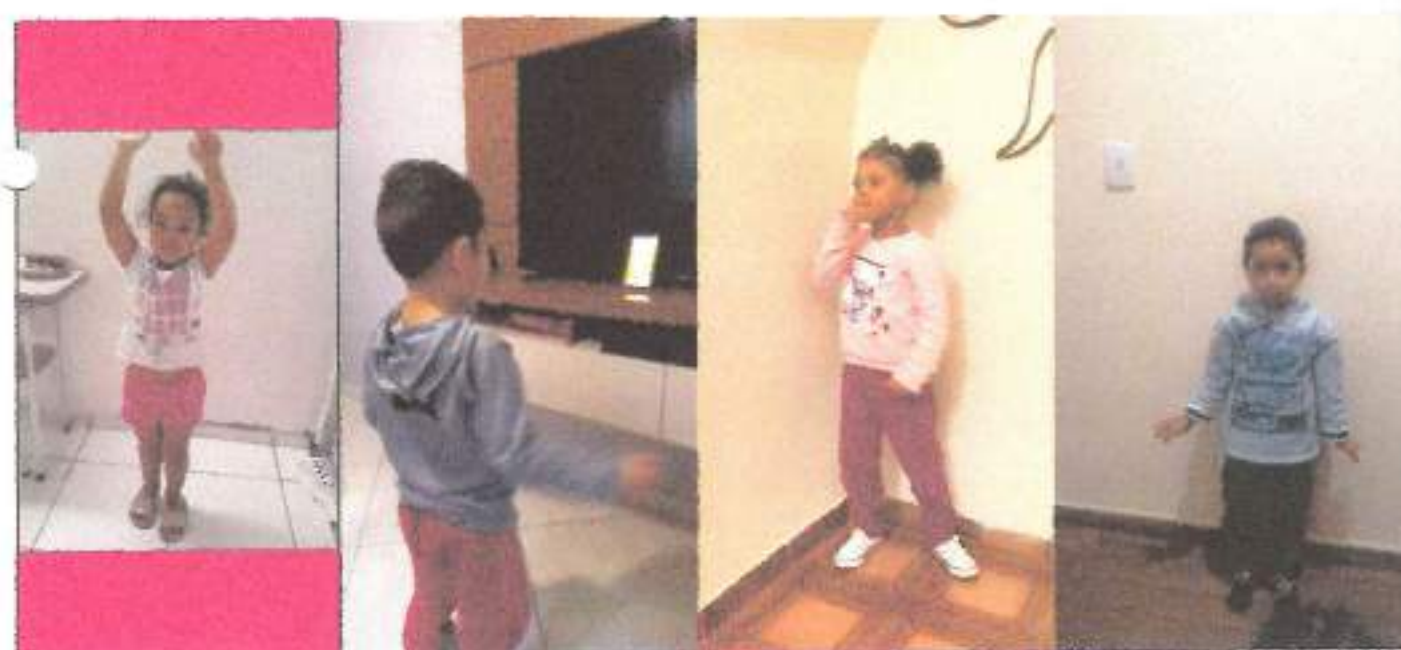
Praticando a lateralidade, agilidade e coordenação motora.