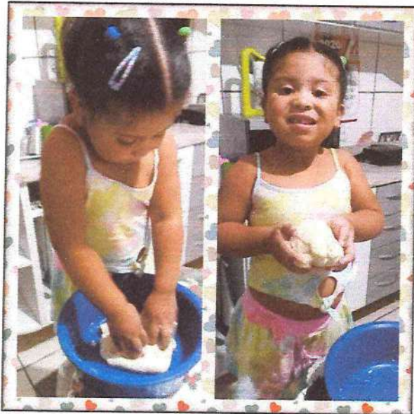
Fase I A