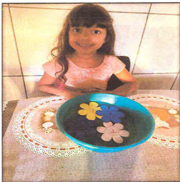
Fase II A