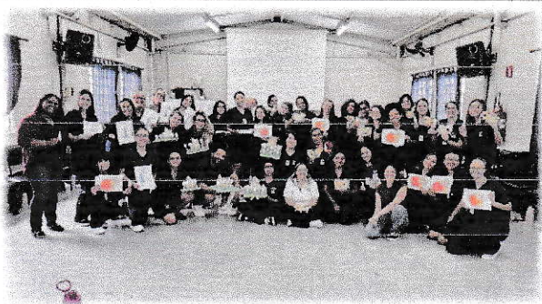
(A SAINT GOBAIN – Artes)